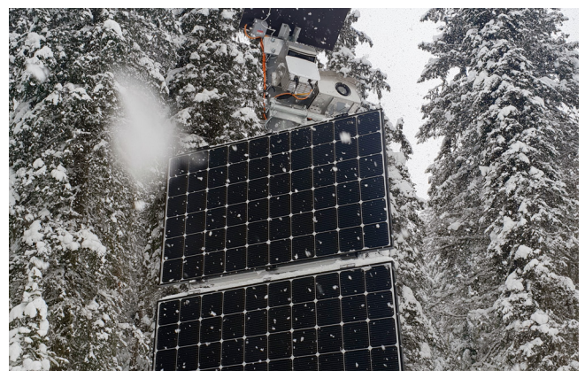
Abbildung 3: Das Lawinenradar detektiert Lawinen in allen Sichtverhältnissen zuverlässig: Tag/Nacht, bei Nebel, Schnee oder Regen.