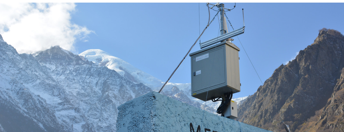
Titelbild: Die grossen Murgang-Ablagerungen sind neben der Strasse und dem Kraftwerk ersichtlich.